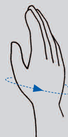
Tour de paume