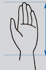
Longueur de main